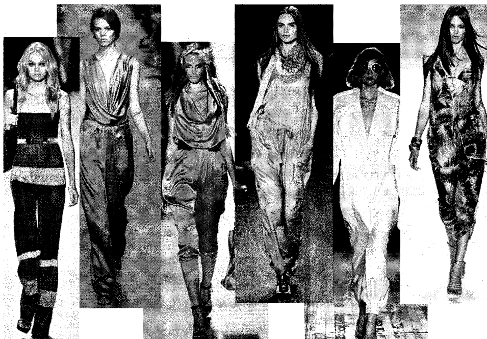
Malo. Una sfilate di «tute» dell'azienda del gruppo It Holding recentemente acquisita da Evante